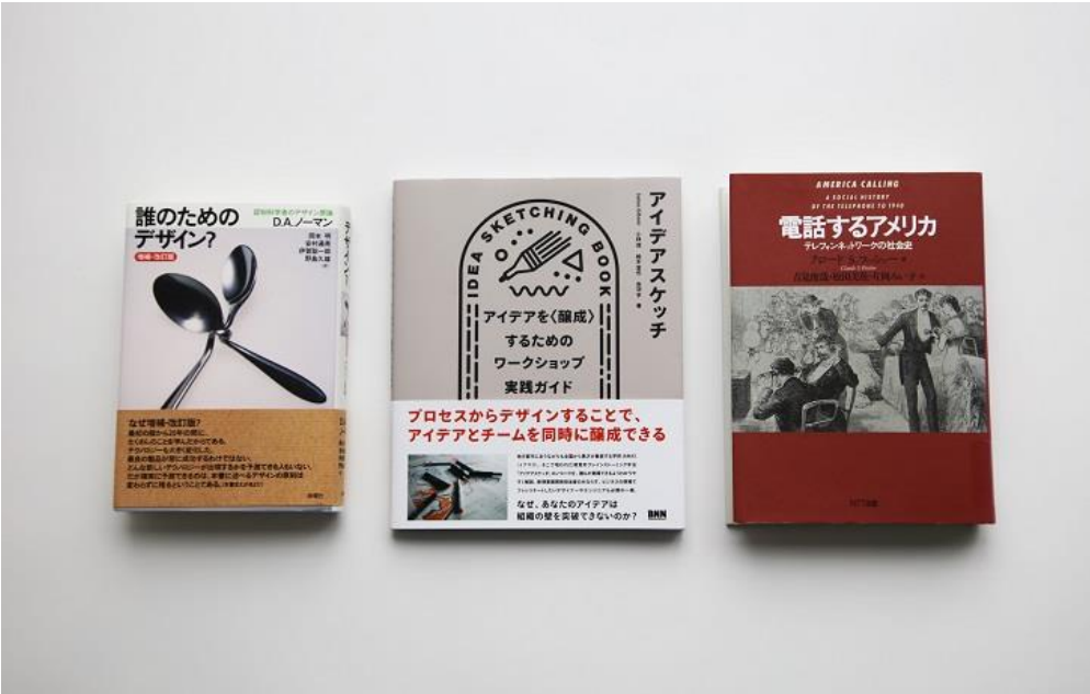
『誰のためのデザイン?』 | 『アイデアスケッチ』 | 『電話するアメリカ』

IAMAS [イアマス] とは、情報科学芸術大学院大学の英語表記の頭文字を取った略称です。